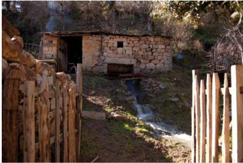
utes ces régions de montagne, au cœur de la Kabylie, et jusqu'aux plaines, c'