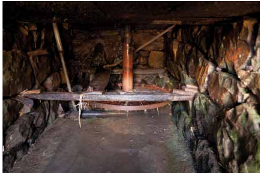
utes ces régions de montagne, au cœur de la Kabylie, et jusqu'aux plaines, c'