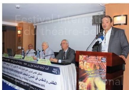
Hommage à Fanny Colonna lors du Colloque Scientifique du FITB'2015 (Hôtel du Nord, novembre 2015)

A Constantine, en décembre 2014, lors des obsèques de Fanny Colonna, on a remarqué la présence de nombreux représentants de la Société civile de la Vallée de la Soummam. C'est d'ailleurs ce jour qu'a été diffusé notre premier texte hommage [24]. La Vallée de la Soummam a attendu la parution de l'ouvrage « La vie ailleurs » (sur Seghir Nait Touati et le Dépôt de Calvi) pour organiser un hommage à la dimension de sa contribution [35]. Ce sera en juillet 2015, lors du Festival de Tinebdar, organisé à l'occasion du 630 ème anniversaire de la mort du juriconsulte Abderrahmane al-Waghlisi (voir illustration jointe).