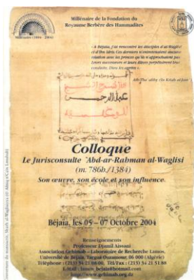
Affiche du Colloque International sur al-Waghli (2004)

Un compte rendu de la thèse de doctorat sur le GEHIMAB est publié par la revue Insaniyat