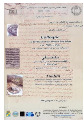
Affiche du Colloque sur Ahmed Ben Idris (2006)