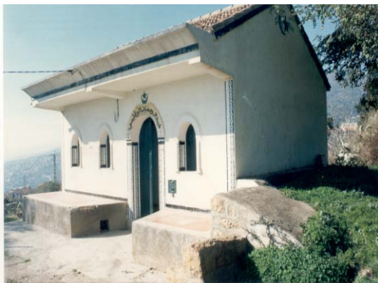
Le Mausolée Sidi Abderahmane El-Ouaghlissi à Tala Tagouth – Tinebdar (Sidi Aïch)

Plusieurs institutions (et organismes) locales et nationales, sous la coordination de l'Association Gehimab Béjaïa.